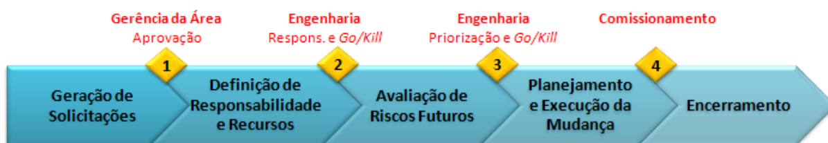
Figura 3 - Esquema do Novo Processo de Gestão de Projetos

O novo processo apresentado na íntegra no ANEXO C, foi resumido na forma de um esquema com suas principais etapas conforme a Figura 3 a seguir.