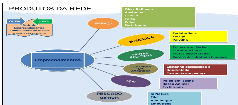
Figura 08 – Produtos da Rede

simplificada demonstra o portfólio de produtos e seus derivados previstos para serem processados e comercializados pelos empreendimentos da rede.